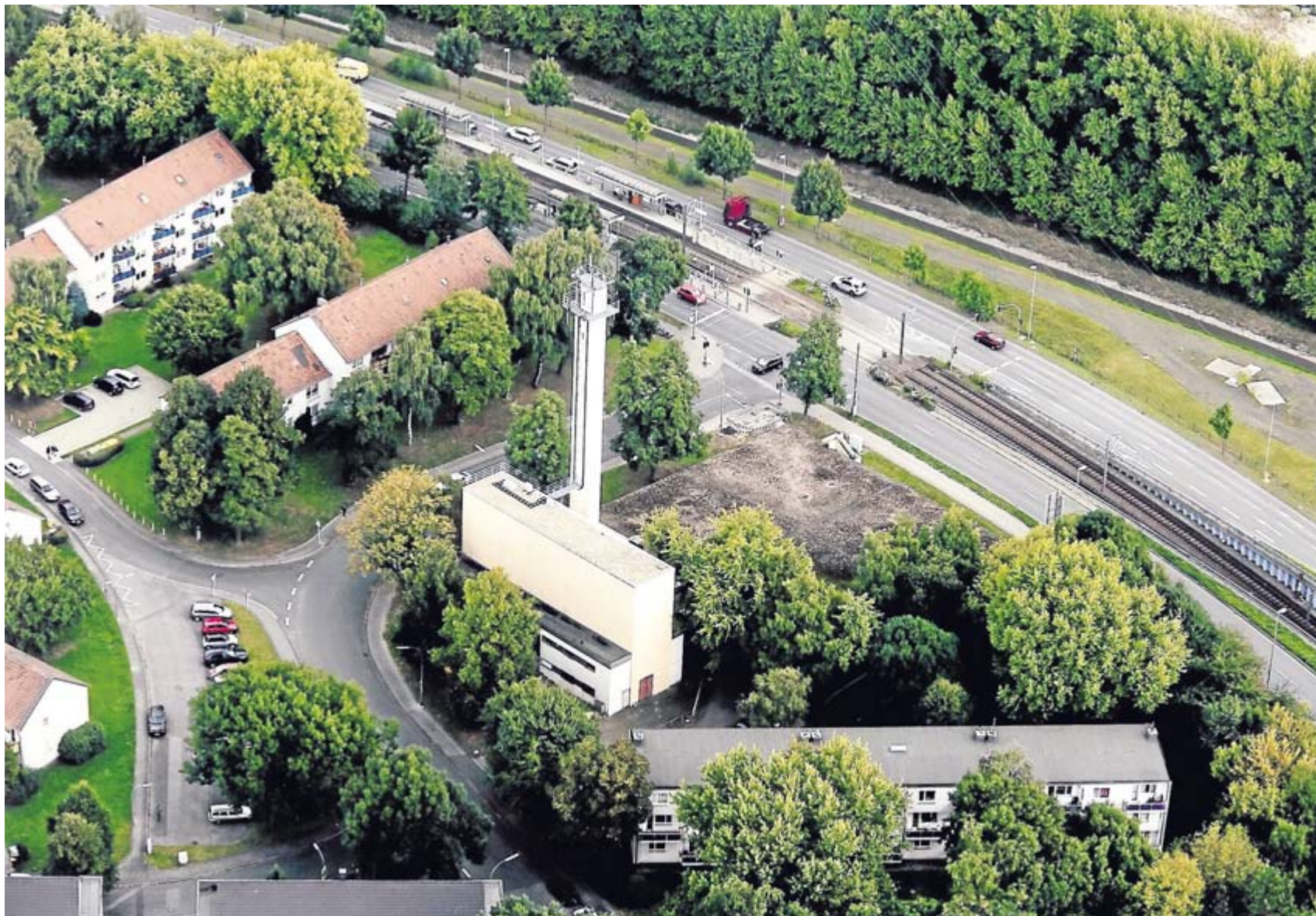
Der Firmensitz in einem ausgebauten ehemaligen Heizkraftwerk liegt verkehrsgünstig in Dortmund-Huckarde mit Anbindung an die Autobahn und Straßenbahn.