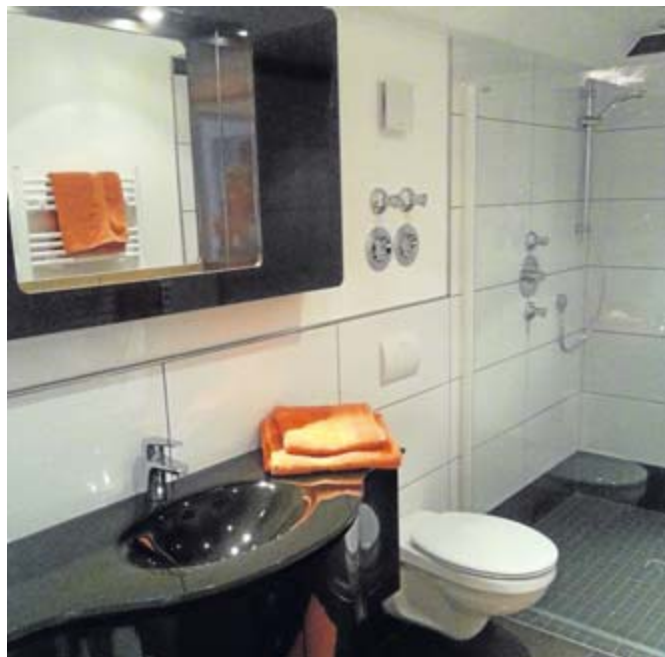
Auch die Bäder im Boarding-Haus sind nach modernsten Standards ausgestattet.

Nach dem Fall der Mauer begann eine spannende Zeit für den agilen Unternehmer: Zwei Jahre lang leitete er für die Dortmunder Firma Haakhorst